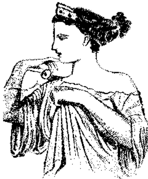
Ryc. 6 Fryzura grecka „ Lampadion ” (400 r. p.n.e.)

Do najbardziej znanych stylowych uczesań greckich należała fryzura o nazwie „ Lampadion ” (płomień) – (ryc. 6).