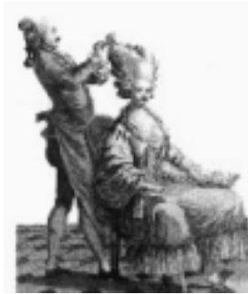
Ryc. 10 Fryzura rokoko

W tym okresie modzie w całej Europie nadawał ton dwór francuski. Fryzury rokokowe początkowo dość niskie, z biegiem czasu stawały się coraz wyższe, bardziej fantazyjne i skomplikowane (ryc. 10).