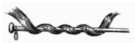
Ryc. 2 Sztabka z brzoza do układania włosów w loki używana przez starożytnych Egipcjan