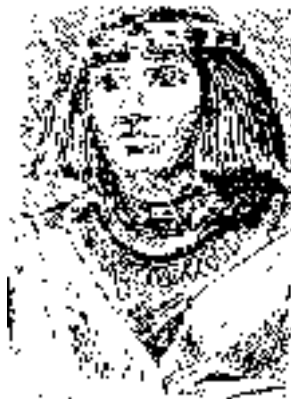
Ryc. 4 Nefretete – fryzura egipska

Rzeźby i malowidła egipskie świadczą o tym, że pielęgnowanie włosów znane było już w starożytnym Egipcie. Cechą charakterystyczną fryzury był jej kształt zbliżony do trapezu. Włosy splatano przeważnie w drobne warkoczyki i obcinano w taki sposób aby tworzyło uczesanie na tzw. pazia (ryc. 4). Wykonanie takiej fryzury było bardzo pracochłonne.