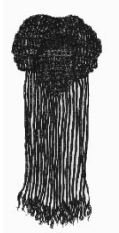
Ryc. 5 Peruka z długimi włosami używana przez starożytnych Egipcjan

Również kolor włosów miał duże znaczenie w obowiązującej modzie, utrzymywano je w kolorze ciemnobrązowym i czarnym, używając do tego min. Barwnika roślinnego - henny. Malowano również paznokcie. W późniejszych czasach robiono fryzury kobiece z własnych włosów, stosowano trwałą ondulację. Pielęgnowanie i układanie włosów należało do niewolnic, przy czym każda z nich miała powierzone czynności, jak mycie, czesanie, farbowanie.