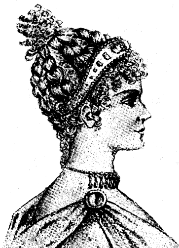
Ryc. 8 Fryzura rzymska

Moda starożytnego Rzymu stawiała fryzjom kobiecym o wiele wyższe wymagania niż fryzjom mężczyznom, którzy ze względów etycznych nosili włosy krótko przystrzyżone (ryc. 8).