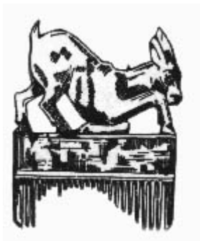
Ryc. 1 Ozdobny grzebień z drewna hebanowego używany przez starożytnych Egipcjan

Z dokonanych odkryć i badań wynika, że już ok. 5000 lat p.n.e. pielęgnowaniu ciała ludzkiego poświęcono wiele uwagi i troski. Niemal we wszystkich dawnych kulturach znajdujemy przedmioty służące do pielęgnacji i układania włosów. Stosowano różnego rodzaju środki, przyrządy i ozdoby, które umożliwiały nadawanie modnego w danym okresie wyglądu.(ryc. 1, 2, 3).