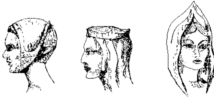
Ryc. 9 Uczesania i nakrycia głowy z czasów średniowiecza