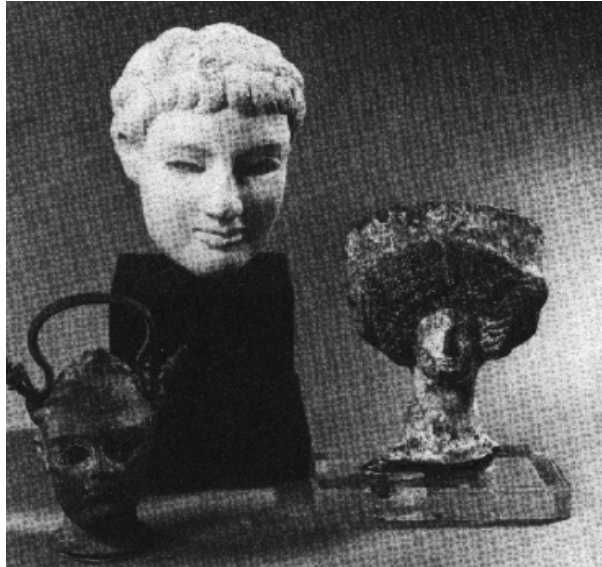
Ryc. 7 Fryzura „tutusowa” z czasów rzymskich, początek n.e.

W okresie rozkwitu Cesarstwa Rzymskiego fryzury uzyskały kształt bardziej bogatych i urozmaiconych różnymi ozdobami (ryc. 7).